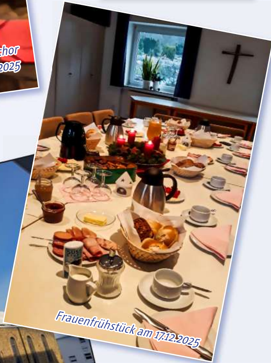
Frauenfrühstück am 17.12.2025