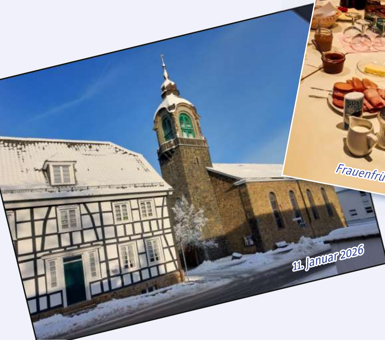
11. Januar 2026