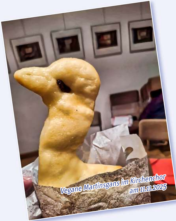
Vegane Martinsgans im Kirchenchor am 11.11.2025